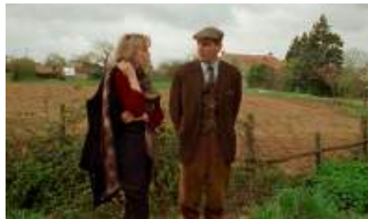
▲ L'Arbre, le maire et la médiathèque (1993)

ainsi la preuve que la télévision n'est pas l'ennemie du cinéma, mais qu'ensemble, spectateurs réunis, cette vision élargie du film permet un magnifique bouche-à-oreille !