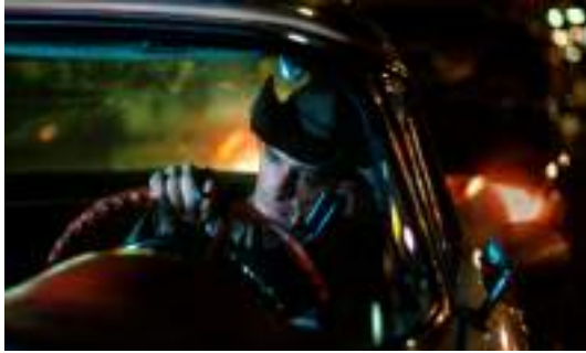
▲ L'Ami américain (1977)