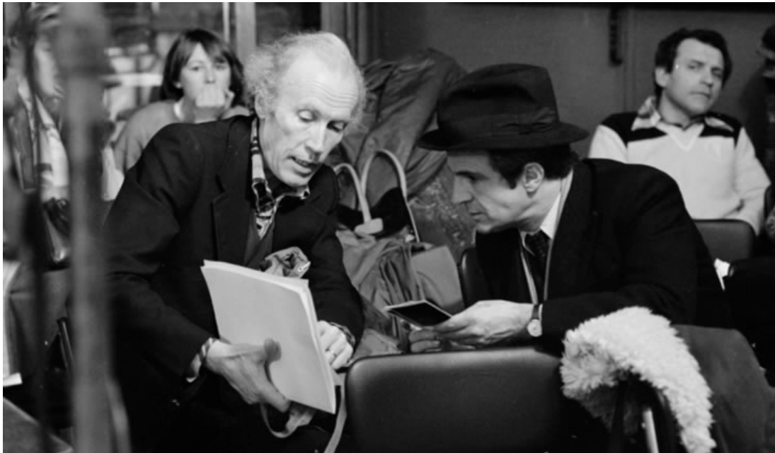
▲ Eric Rohmer et François Truffaut sur le tournage de La chambre verte (1978)

américaine ! » Le public français répond lui aussi présent, faisant du film un succès surprise avec 2 millions d'entrées en France, avant une nomination à l'Oscar du meilleur film étranger à Hollywood. En l'espace de quarante-huit heures qui séparent les premières de More et Ma Nuit chez Maud à Cannes, Les Films du Losange a consolidé une solide réputation en France, en Europe et au-delà.