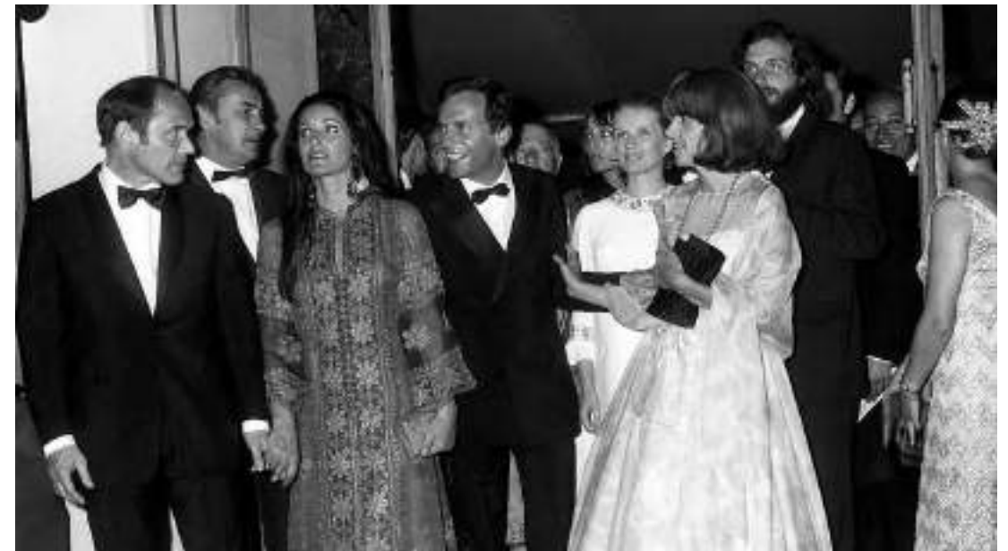
▲ Présentation de Ma nuit chez Maud à Cannes

le plus célèbre jusqu'à aujourd'hui, dont « l'engagement échappe au quotidien », écrit alors Le Monde . La dimension littéraire du dialogue, la rigueur du style, la pudeur des rapports de séduction déconcertent les festivaliers qui retrouvent Cannes après l'annulation de l'édition précédente et les élans de mai 1968. Barbet Schroeder se souvient de la projection cannoise : « Ils n'aimaient pas du tout, ils s'embêtaient, ils se levaient. C'était un bide comparable à celui de L'Avventura d'Antonioni. J'ai revu le film quelques temps plus tard outre-Atlantique : on y percevait l'humour des dialogues, c'était devenu une comédie