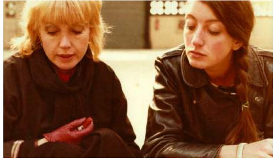
▲ Le Pont du Nord (1980)

de dix-sept ans, qui deviendra cheffe comptable, restera employée pendant plus de quarante-cinq ans, et sera régulièrement figurante chez Rohmer ou Rivette. Dans le bureau personnel d'Eric Rohmer, les rencontres avec de jeunes comédiens - toujours autour d'un thé et de biscuits secs - servent de laboratoire d'écriture pour les irrésistibles Comédies et Proverbes (1981-1987). Parmi eux brille Pascale Ogier, l'inoubliable muse des Nuits de la pleine lune . Fauchée en pleine ascension, la jeune femme décède brutalement en 1984, un mois à peine après son triomphe à la Mostra de Venise, où elle remporte pour le film la Coupe Volpi de la Meilleure Actrice. Présente également dans Perceval le Gallois de Rohmer (1979) et Le Pont du Nord de Rivette (1982) au côté de sa mère Bulle, Pascale Ogier demeure jusqu'à aujourd'hui une icône dans le monde entier, et fixe éternellement une créativité débridée et une audace propres à ce mi-temps des années 1980... En 1986, le tournage en large partie improvisé du Rayon vert de Rohmer incite à en proposer une diffusion innovante, avec une avant-première sur la jeune chaîne cryptée Canal+. Le film remporte le Lion d'Or à Venise et attire 500 000 spectateurs en salles. Le Losange fait