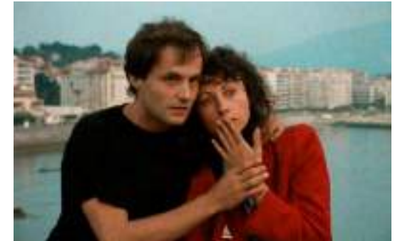
▲ Le Rayon vert (1986)

Tandis que Barbet Schroeder part pour les États-Unis où il restera installé pour