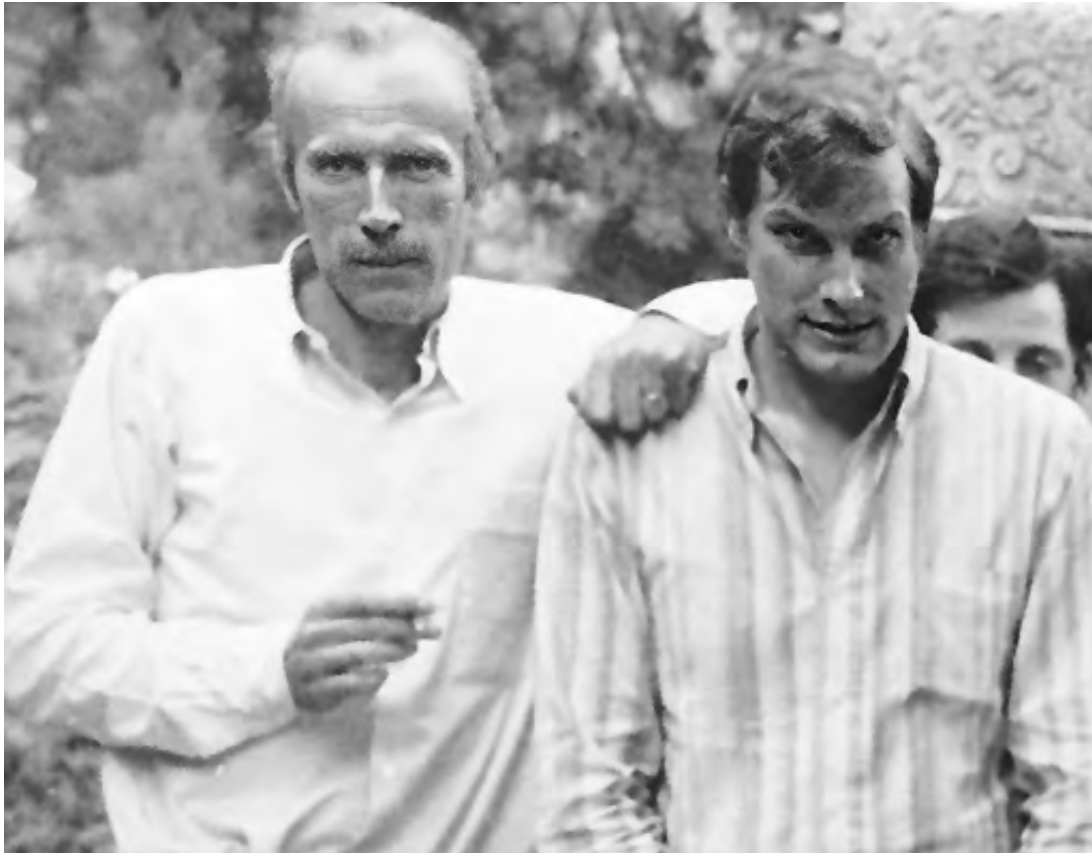
▲ Eric Rohmer et Barbet Schroeder