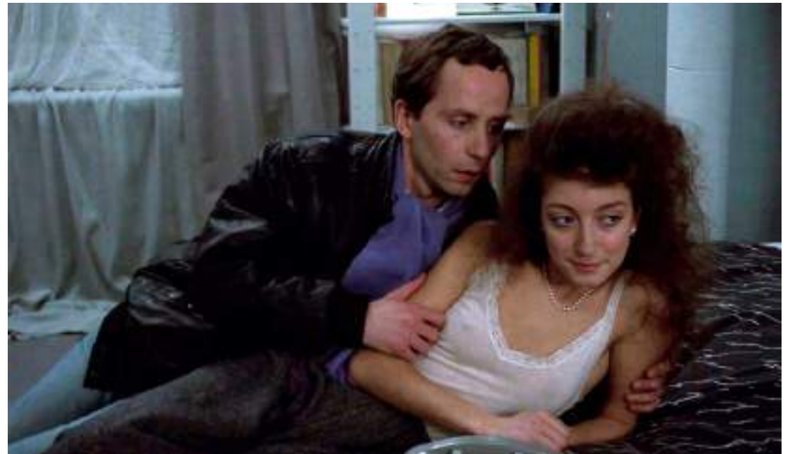
▲ Les Nuits de la pleine lune (1984)