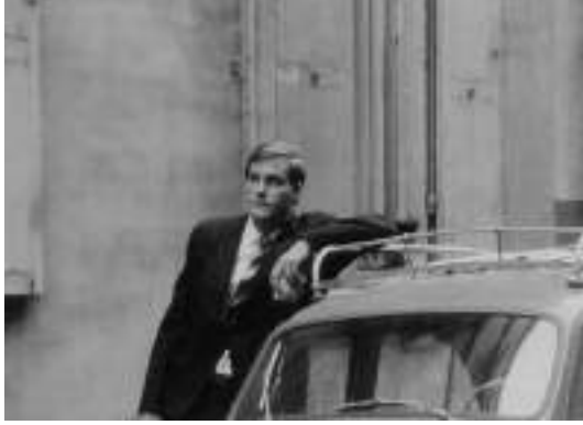
▲ Barbet Schroeder sur le tournage de La Boulangère de Monceau