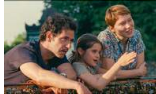
▲ Un beau matin (2022)

Ces deux dernières années, Les Films du Losange orchestre le retour en salles