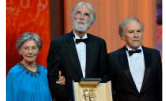
▲ E. Riva, M. Haneke, J-L. Trintignant - Amour (2012)

La présence des films lors des grands festivals internationaux a toujours été un enjeu de premier ordre aux Films du Losange : à Cannes (cinquante films en Compétition dont onze primés, quarante en sélections parallèles), Venise (quinze films dont dix primés) et Berlin (trente films dont dix primés). Les trois Palmes d'Or en témoignent ( Dancer in the Dark , de Lars von Trier en 2000, Le Ruban blanc et Amour , de Michael Haneke en 2009 et 2012), de même que les deux Lions d'Or d'Eric Rohmer ( Le Rayon vert , 1986) et de Roy Andersson ( Un Pigeon perché sur une branche philosophait sur