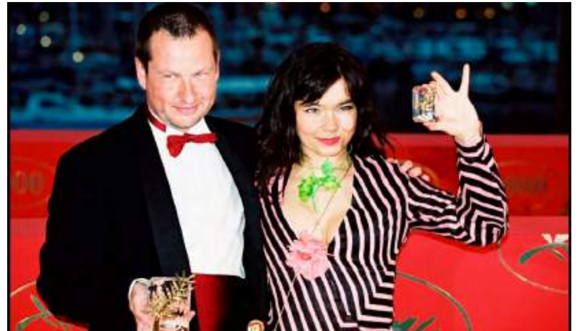
Lars von Trier et Björk, Palme d'Or et Prix d'interprétation à Cannes en 2000 pour Dancer in the dark