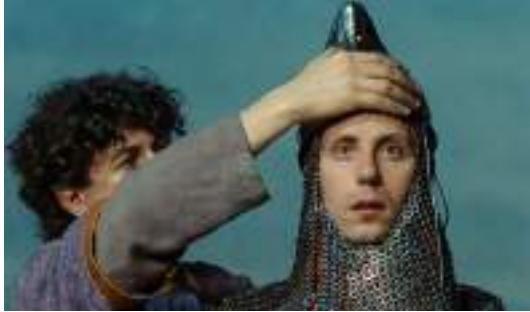
▲ Perceval le gallois (1978)