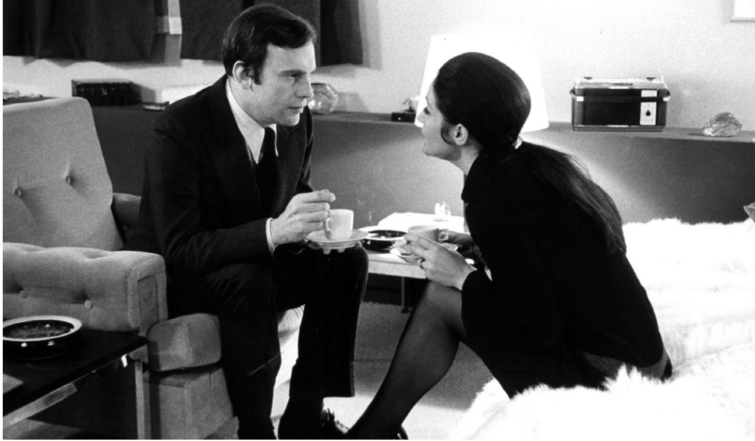
▲ Ma nuit chez Maud (1969)