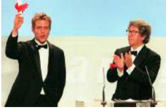
Thomas Vinterberg, Prix du Jury pour Festen à Cannes 1998

le mercredi de sa sortie à 14h, avec les spectateurs ! » Ils sont bel et bien au rendez-vous, le 10 février, au Balzac et au St-Germain-des-Prés, où le film démarre sa belle et longue carrière en salles.