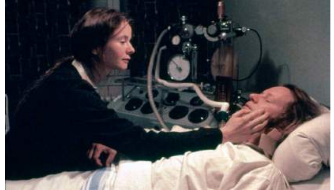
Breaking the waves (1996)

Arrive également Lars von Trier, avec le choc Breaking the Waves , Grand Prix au Festival de Cannes en 1996 et César du meilleur film étranger en 1997. Pour la troisième fois de son histoire, après la Nouvelle Vague des années 1960 et le Nouveau Cinéma Allemand des années 1970, le Losange est partie prenante d'un grand mouvement cinématographique, une tentative très radicale de renouvellement. Lancé par Lars von Trier et Thomas Vinterberg, le Dogme95, dans un souci d'art pauvre et engagé, a édicté quelques préceptes tout à la fois techniques, économiques, esthétiques, donc moraux, qui ont marqué leur temps. Au Festival de Cannes 1998, deux films danois distribués par le Losange incarnent cette soif de retour aux origines austères du cinéma, envisagé comme un art-coup de poing : Festen de