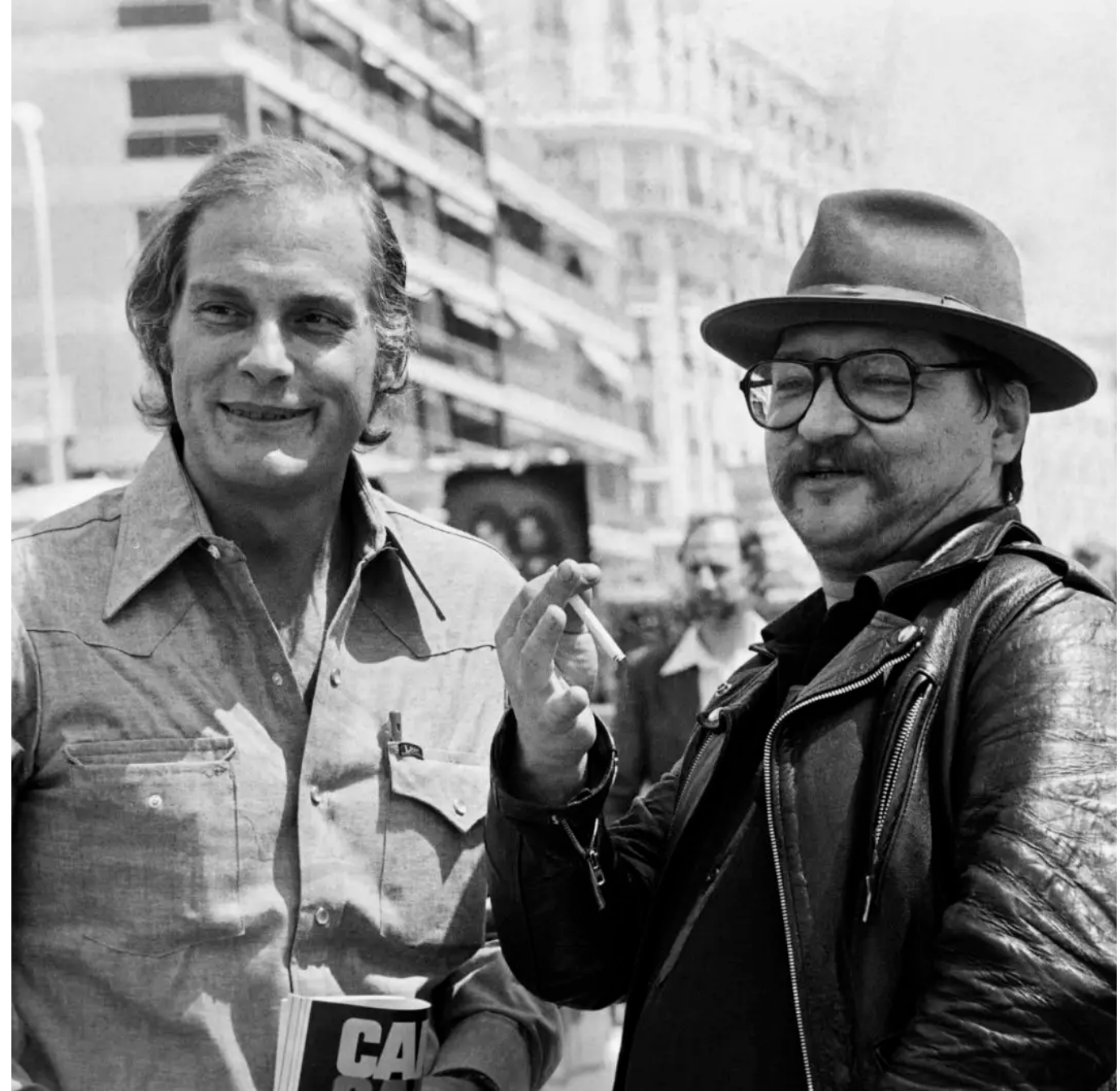
▲ Barbet Schroeder et Rainer Werner Fassbinder le 12 mai 1979 au Festival de Cannes

Nombre de cinéastes francs-tireurs rejoignent le Losange, français ou étrangers : en plus de Jacques Rivette et Jean-Luc Godard, on peut citer Daniel Schmid, Jean-François Stévenin, Marguerite Duras, Frédéric Mitterrand, Jean-Marie Straub & Danièle Huillet ou encore Roger Planchon. L'ouverture du