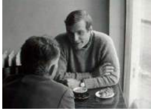
▲ Barbet Schroeder dans Paris vu par...