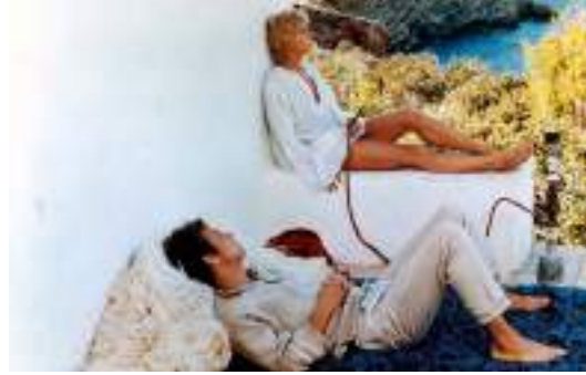
▲ More (1969)