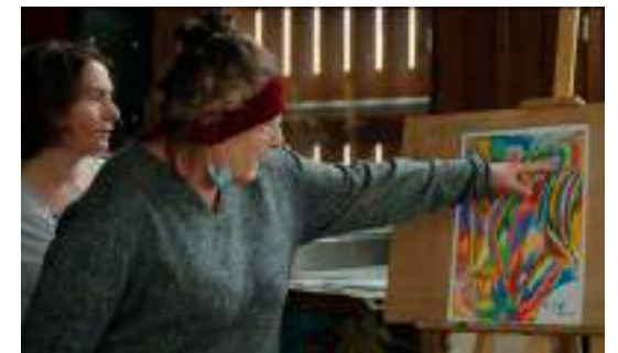
▲ Sur l'Adamant (2023)

d'auteurs tels que Jean Eustache, en restaurant l'intégralité de ses films, Jacques Rivette avec la magnifique restauration 4K de L'Amour fou , et accueilli de nouveaux venus tels que Alice Diop et Albert Serra, qui remportent le Prix Louis-Delluc ex-aequo pour Saint Omer et Pacifiction - un doublé sans précédent pour une société de distribution. Des films d'auteurs français et internationaux fidèles à la maison complètent la période, tels que Un Beau matin de Mia Hansen-Løve ou l'Ours