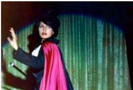
▲ Céline & Julie vont en bateau (1974)

Autre figure fondatrice de la Nouvelle Vague, Rivette est toujours défendu par Rohmer au Losange malgré la fin houleuse de leur collaboration aux Cahiers du Cinéma. Barbet Schroeder raconte : « Quand un projet de Rivette se présentait, Rohmer insistait toujours pour que nous participions au financement. Car il considérait que Rivette était l'un des représentants les plus emblématiques du