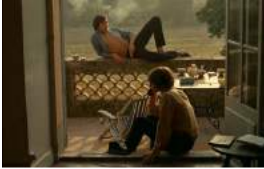
▲ La Collectionneuse (1967)

États-Unis. » Deux triangles assemblés formant un losange, « c'est deux fois plus fort » lui suggère-t-on ! La (toute) petite société s'installe dans l'appartement maternel, 30 rue de Bourgogne, dans le VII ème arrondissement, avec comme bureau... la chambre de la mère de Barbet Schroeder. Typique d'une Nouvelle Vague en prise avec l'environnement direct des créateurs, le deuxième Conte moral de Rohmer, La Carrière de Suzanne , se tourne en grande partie dans la même rue de Bourgogne. La première facture émise par le Losange date du 26 février 1963 : il s'agit de louer une caméra Paillard-Bolex pour vingt-et-un francs la journée ; et le premier contrat du 13 mars 1963, pour la production de La Carrière de Suzanne .