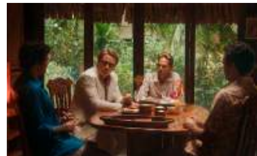
▲ Pacifiction (2022)