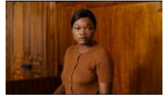
▲ Saint Omer (2022)