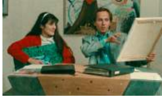
▲ Quatre aventures de Reinette & Mirabelle (1987)